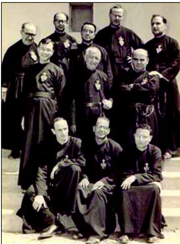
Os Missionários Passionistas vieram da Itália e se instalaram em Minas Gerais e no Espírito Santo

No Ensino Médio, a proposta pedagógica prioriza a aquisição de competências, através do desenvolvimento de habilidades. Os conteúdos são tratados de maneira interdisciplinar e correspondem ao meio pelo qual o aluno constrói seu conhecimento e