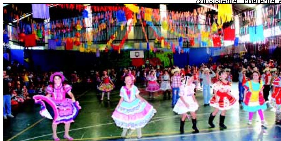
Cultura e diversão também fazem parte das atividades