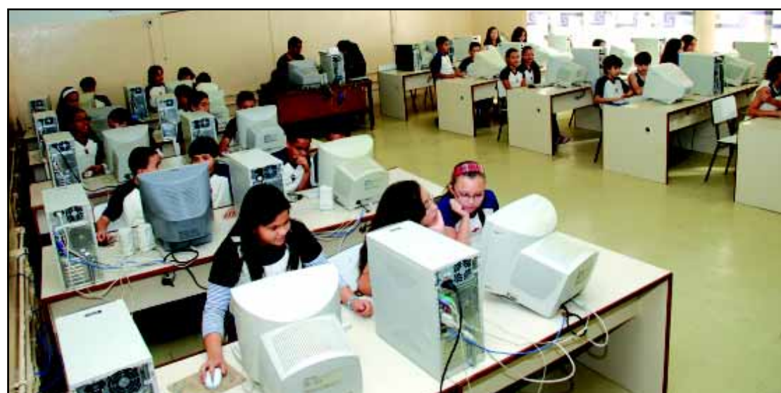
Tecnologia como ferramenta de estudo é prioridade na Instituição

alunos do Ensino Médio que se destacam são premiados como uma viagem para a Itália, onde têm a oportunidade de ter contato com a cultura de outro continente. O objetivo desse programa é a valorização do