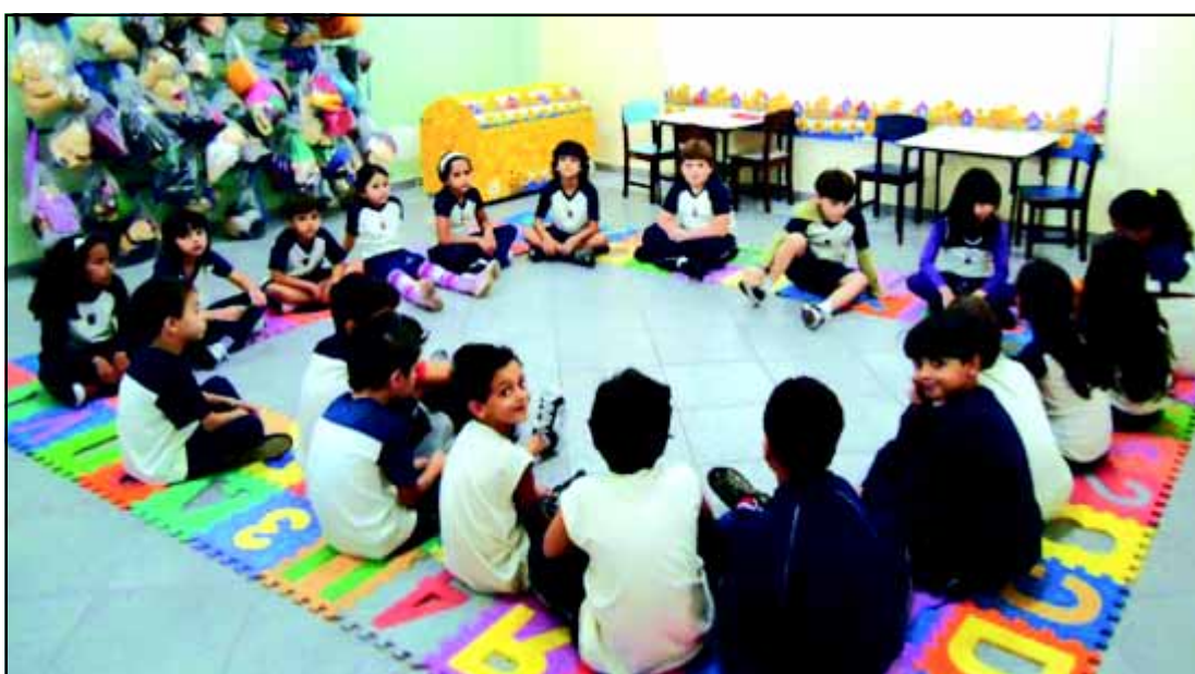
Biblioteca infantil contribui para o ensinamento das crianças

Através de uma proposta pedagógica consistente, coerente e