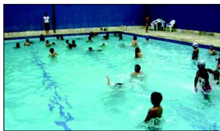
Esporte é saúde

nidade em que os alunos acolhem a comunidade carente, organizando um lanche coletivo e realizando a distribuição dos alimentos arrecadados.